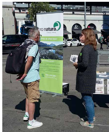
Sensibilisierung der Bevölkerung für die Problematik bei der Abstimmung über das Jagdgesetz

Pro Natura Freiburg hat Einspruch gegen eine Revision der Ortsplanung der Stadt Freiburg eingelegt. Im Mittelpunkt dieser Massnahme stand eine Neueinzonung der Pisciculture-Zone als Bauland am Rande eines wunderschönen Naturschutzgebietes. Pro Natura Freiburg vertritt die Ansicht, dass der demografische Wandel der Stadt Freiburg keine Nutzungsänderung dieses Gebietes rechtfertigt. Glücklicherweise fanden unsere Argumente bei der Stadt Gehör, denn in der neuesten Fassung der Ortsplanung wird der Status quo in dieser schönen Windung der Saane aufrechterhalten.