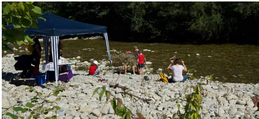
Participants à la journée sur le Gammare à Marly

Le Gammare des ruisseaux : quel animal discret mais surprenant ! Cette crevette d'eau douce, largement répandue en Suisse mais peu connue du grand public, est un ambassadeur des cours d'eau propres et diversifiés. C'est pour découvrir toutes les facettes de cet animal de l'année 2021 de Pro Natura que notre section et son groupe Jeunes+Nature ont mis sur pied, le 4 septembre, un parcours didactique le long de la Gérine à Marly. Une quarantaine de personnes, enfants et adultes, ont suivi la piste d'Oscar le gammare.