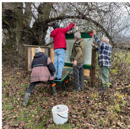
Pose de l'un des nouveaux panneaux d'information dans la réserve naturelle de l'Auried

Grâce aux assouplissements des mesures sanitaires en lien avec la pandémie, plus de classes ont pu bénéficier d'excursions guidées en 2021. C'est malheureusement toujours moins qu'en 2019. Mais de manière générale, nous avons constaté une augmentation visible du nombre de visiteurs sur le site.