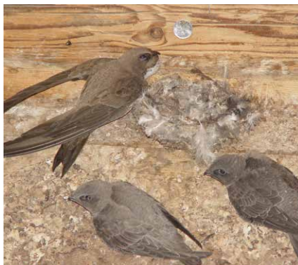
Martinets à ventre blanc et leurs jeunes au nid

Tirage: 100 ex. français, 100 ex. allemand