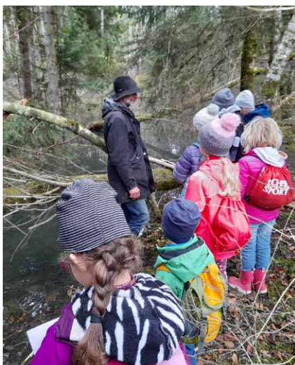
Observation des traces du castor lors de la sortie J+N de novembre à Planfayon

Le groupe J+N a poursuivi sa collaboration avec Le Panda Club du WWF en 2021. Grâce à l'engagement des quatre moniteurs actifs, le groupe J+N a proposé sept activités aux enfants âgés de 6 à 12 ans, dont trois en allemand. Malheureusement deux sorties ont dû être annulées, une en raison des mesures sanitaires et la seconde en raison de violents orages. Les autres activités ont rencontré un beau succès et ont permis à plus d'une cinquantaine d'enfants de découvrir de très près la nature qui les entoure.