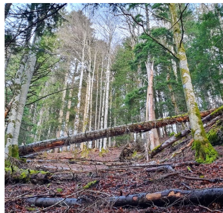
La forêt des Veitours (Jaun) comporte une grande proportion de bois mort, élément essentiel d'une forêt riche en biodiversité.