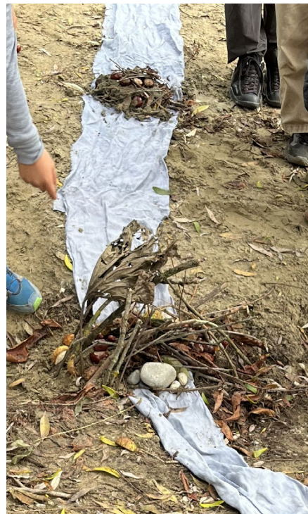
Les enfants ont eu l'occasion de découvrir le castor, ses huttes et ses barrages lors de la sortie J+N de septembre.