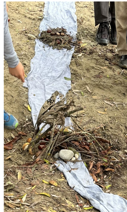
Les enfants ont eu l'occasion de découvrir le castor, ses huttes et ses barrages lors de la sortie J+N de septembre.