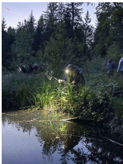
Le public a pu découvrir de très près les amphibiens lors des deux sorties guidées proposées en mai.

A l'avenir, nous souhaitons faire connaître Pro Natura Fribourg en tant qu'acteur majeur de la sensibilisation à la nature dans le canton de Fribourg et ainsi faire découvrir aux curieux·ses, convaincu·es ou non, les beautés et les richesses de la nature fribourgeoise. Nous reconduisons ainsi ce projet et notre programme d'activités 2026 sera envoyé à tous nos membres et distribué au grand public dès mars 2026, avis aux intéressé·es !