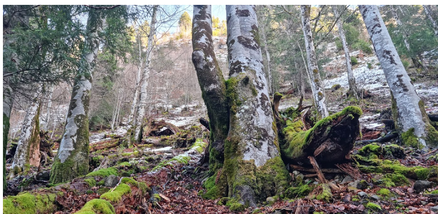
Eboulis et avalanches dus aux terrains pentus viennent structurer le couvert boisé et invitent de nouvelles espèces.