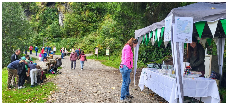
Une centaine de personnes ont pris le départ à l'occasion de notre rallye thématique sur l'eau, organisé le 21 septembre au Lac Noir.

Malgré une météo un peu grise, notre journée thématique annuelle, cette année-ci consacrée au thème de l'eau et tenue au Lac Noir, a rencontré un franc succès ! Une centaine de participant·es a suivi le tracé ponctué de six postes d'activités ludiques et éducatives. Enfants comme adultes ont pu découvrir, en s'amusant, la richesse et la fragilité de l'écosystème aquatique. Cette année, les escargots et leurs cousins aquatiques étaient à l'honneur, en lien avec l'animal de l'année de Pro Natura. Petits jeux, observations et expériences ont permis de mieux comprendre leur rôle essentiel dans nos milieux humides. La section tient à remercier le parc naturel du Gantrisch pour sa participation, ainsi que la commune de Planfayon et le Service des forêts et de la nature pour leur soutien.