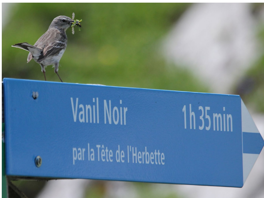
La section propose chaque saison de nouvelles excursions guidées dans la réserve naturelle du Vanil Noir.

Parmi les nouveautés : une sortie à la rencontre de la vipère péliade, aux côtés d'un biologiste qui nous fera découvrir ce reptile aussi discret que fascinant. Puis cap sur un week-end ornithologique avec nuitée en cabane, pour une immersion au