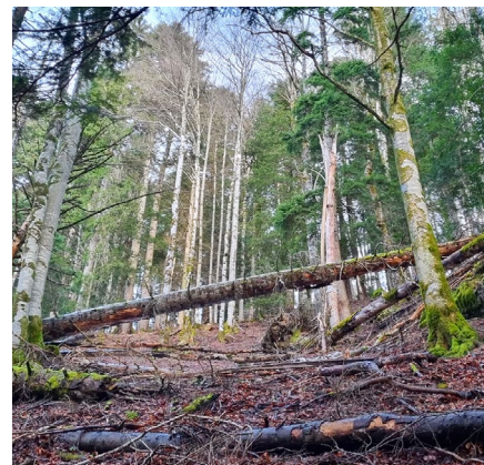
La forêt des Veitours (Jaun) comporte une grande proportion de bois mort, élément essentiel d'une forêt riche en biodiversité.